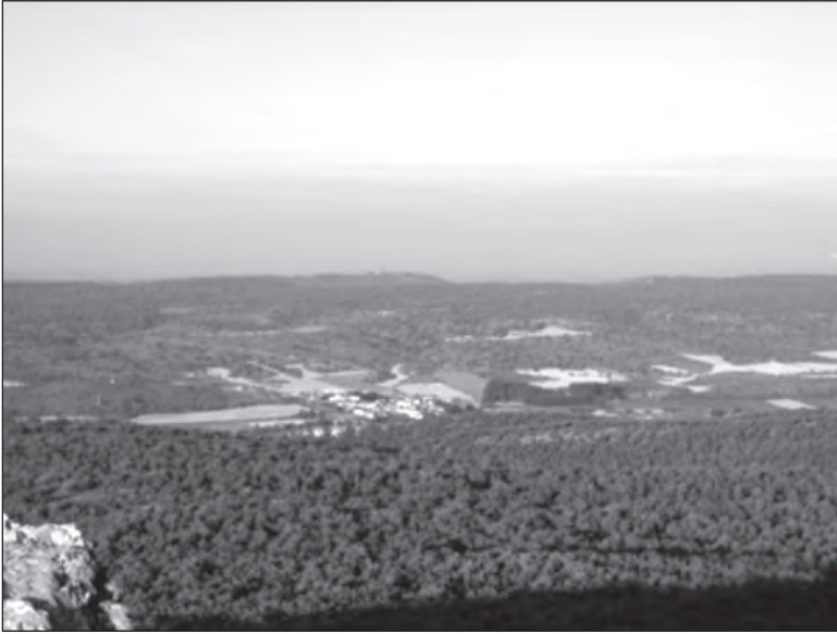
Selas desde Sierra Alta al amanecer

principalmente quejigos y gayubas mezclados con algunos enebros; en la parte media y baja, cubierta de pastos y vegetación de roble melojo, quejigos y estepas, salpicados con enebros.