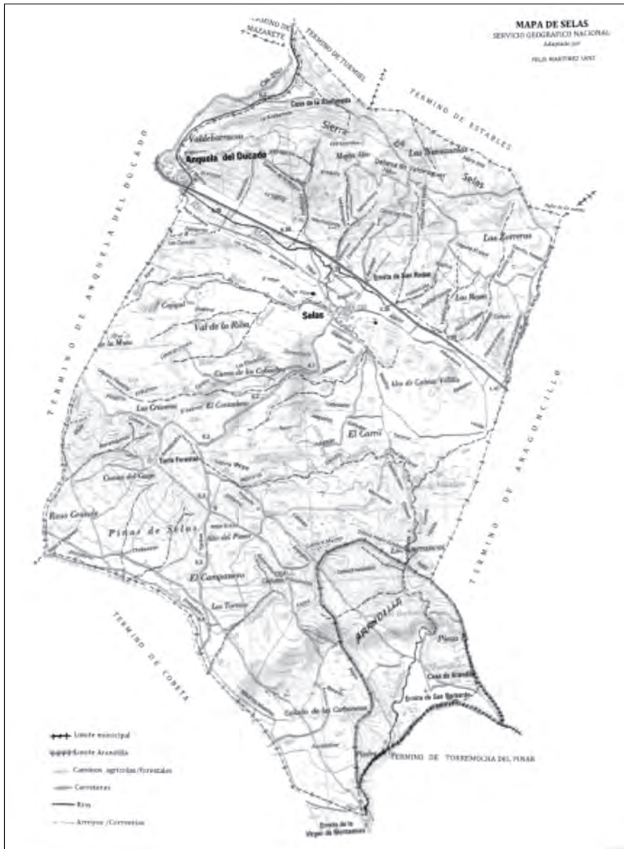
Mapa del término municipal de Selas del Servicio Geográfico Nacional, adaptado por su autor.