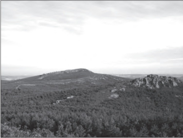
Sierra de Selas (Panorámica)

En el periodo Mesozoico se produce la erosión y sedimentación de los materiales que, al sufrir las consecuencias del plegamiento alpino, dan origen al terreno en su situación actual. Distinguimos tres zonas bien diferenciadas: